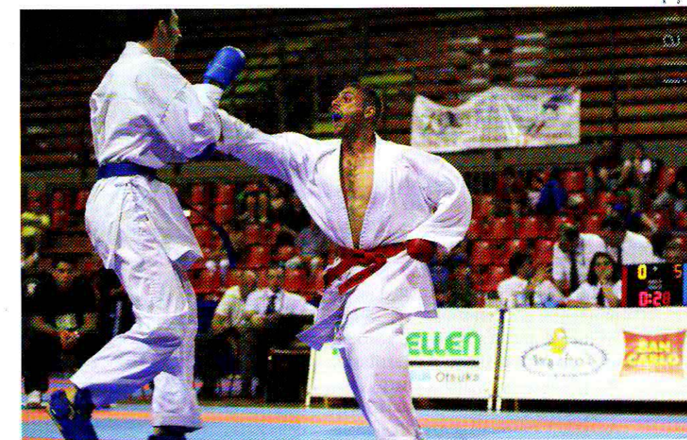
Altamura - Lombardo

prestigiosa rivista francese, BUDO, rivolse ad un noto Maestro di Karate di Okinawa. Alla domanda secca e conclusiva su quale fosse il vero segreto del Karate, il Maestro solarmente rispose: la capacità di sorride-