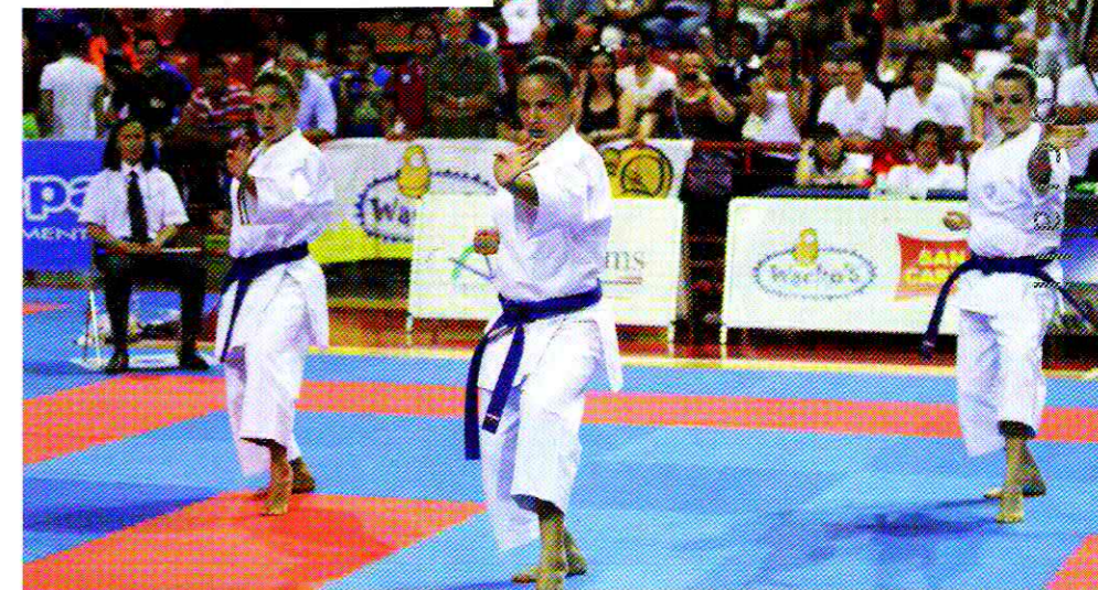
Dojo Dokko-Do - Centro Karate Zaccaro in finale contro Dojo Dokko Do

punteggio il pur munitissimo Centro Karate Zaccaro Matera, ed in semifinale i comunque elogiabili esponenti dell'ASD Centro Karate Sportivo (9-1). La finale vede confrontarsi i due team sul kata di libera composizione, che sarà per gli Atleti con le stellette il noto Fiamme Gialle, rivisitato e perfezionato anno dopo anno con l'aggiunta di sempre nuovi elementi ed integrazioni, un kata in grado di sublimare, oseremmo dire, la performance, la personalità e le potenzialità del fantastico trio; Genesi, per gli Atleti del sodalizio