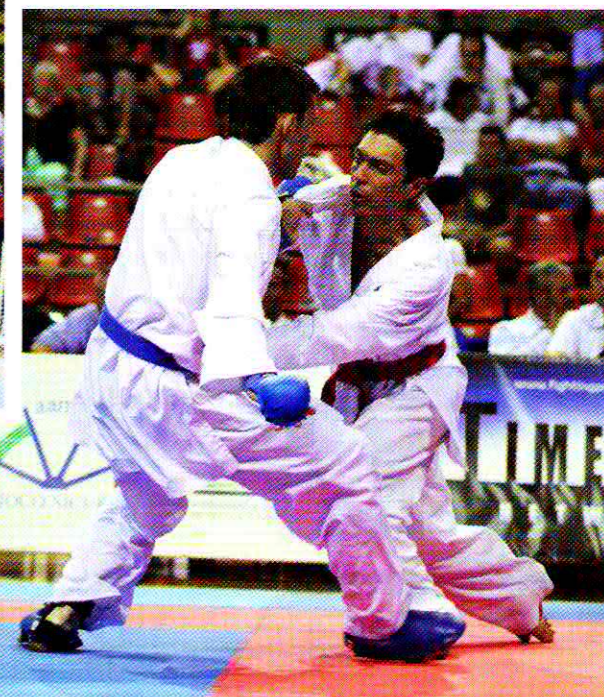
Minervino - Cologgi