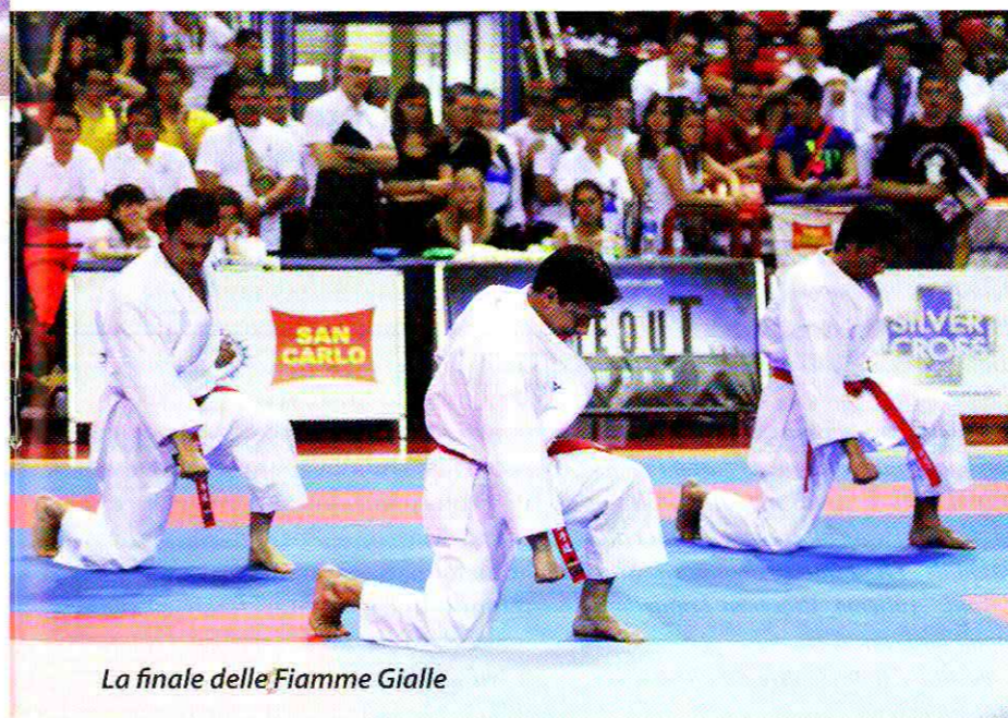
La finale delle Fiamme Gialle

Il Dojo Dokko Do San Pietro Vernotico (BR), forte della fuoriclasse