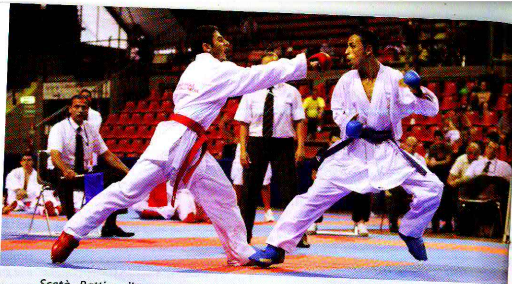
Scatà - Battigaglia